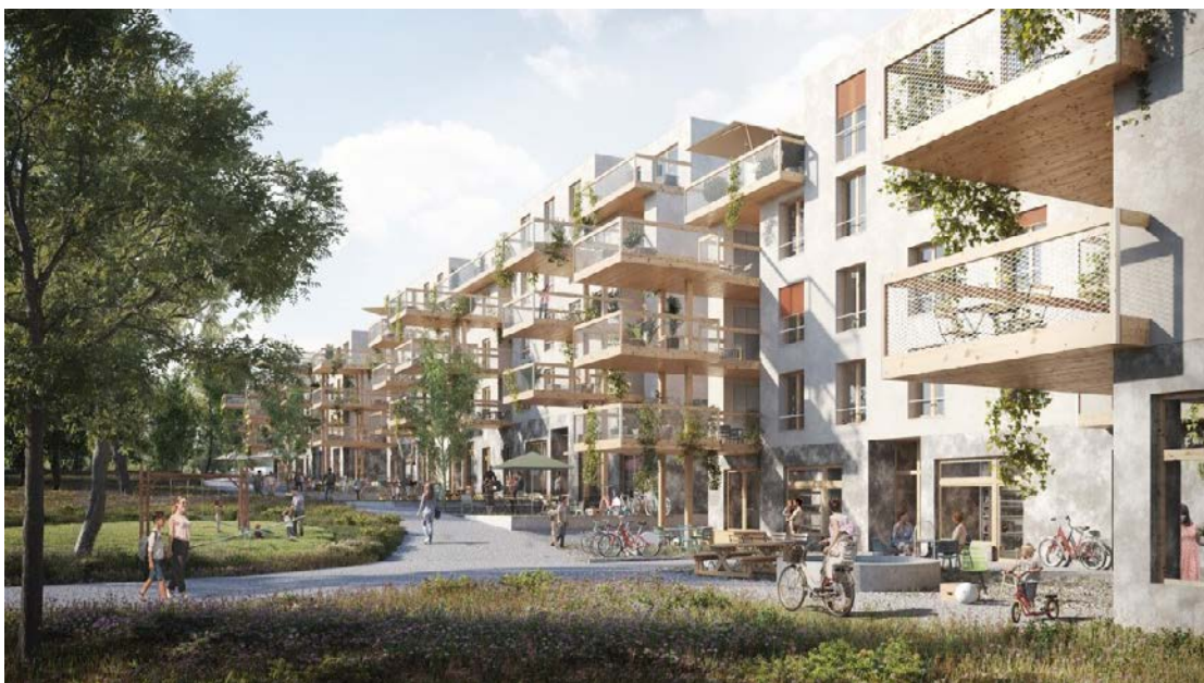
Visualisierung Siegerprojekt «Weben».

Einladung zur Informationsveranstaltung am Montag, 24. August 2020, 19.00 Uhr, im Gemeindesaal.