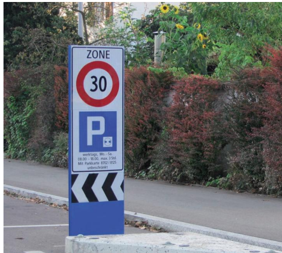
Beispiel Signalisation Parkzonen mit zeitlicher Beschränkung in Zollikon